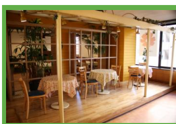
朝食会場:3階 ジョリーテーブル 7:00~9:40

液晶テレビ・電話・インターネット LAN 接続・湯沸かしポット・冷蔵庫(空)・ドライヤー・ズボンプレスサー(貸出)・電気スタンド(貸出)・アイロン(貸出)・加湿器(貸出)・洗浄機付トイレ・石鹸(液体)・ボディソープ・リンスインシャンプー・洗顔ソープ・ハミガキセット・カミソリ・ブラシ・タオル・バスタオル・パジャマ・使い捨てスリッパ・コイン式インターネット(ロビー設置)