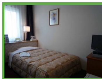
宿泊:シングルルーム 15.5㎡ ベッドサイズ 1,220×1,950

〈主な設備〉ワイレスマイク2本、ピンマイク1本、演台1台、ホワイトボード1枚、★プロジェクター(ビデオ・DVD・PC 対応)、★スクリーン、★DVD・ビデオ一体型プレーヤー、★地上波テレビ視聴システム、★は有料。