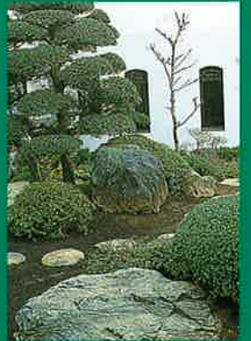
▲八幡神社には、メインの八幡さまのほか、全部で10もの神社が集合しています。それに合わせて、式場の中庭には、和風庭園も。

由緒ある八幡神社での挙式。 狭山東武サロンでの披露宴。 すべてはお客さまの意のままに。