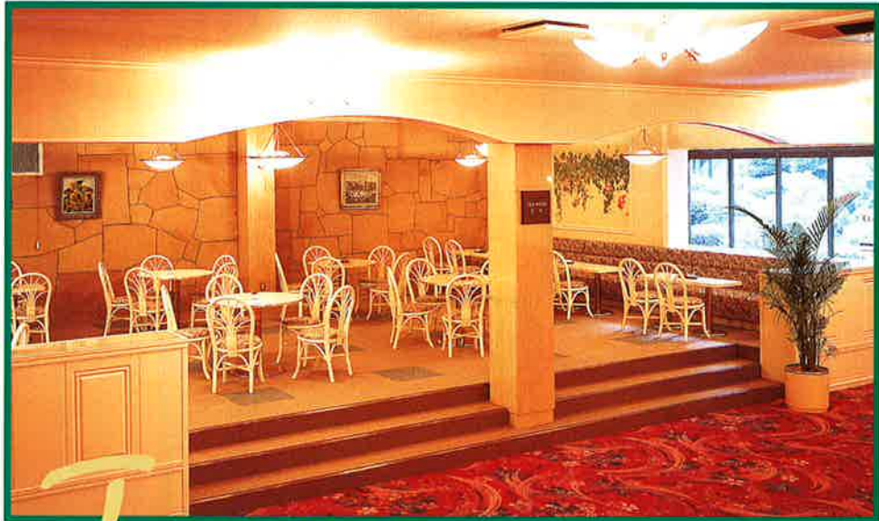
▲1階にあるティールームは、結婚式のお打ち合わせにも便利です。