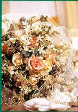
▲当サロンでの結婚式は、ゆとりの1日3組まで。施設はこぢんまりしていますが、その分、ゆき届いたサービスがなによりも自慢です。

伝統的な日本のスタイルを見直す。そして、ゆとりの時間をもつ。小さな式場だからできること。