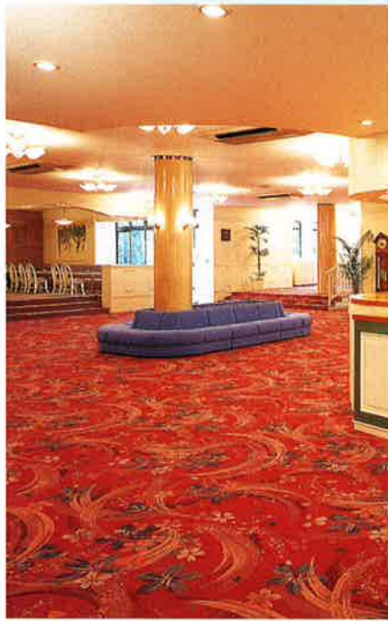
▶ティールームで語らいのひとときを。

館内には、大小4つの宴会場をはじめ、控室や写真室、美容室などの婚礼関係施設のほか、ロビーには婚礼コーナーや喫茶室も完備。全体的にこぢんまりしたつくりながらも、サロン中庭に設けた日本庭園や八幡神社の森が落ち着いた風情をただよわせ、2階からは入間川の流れや