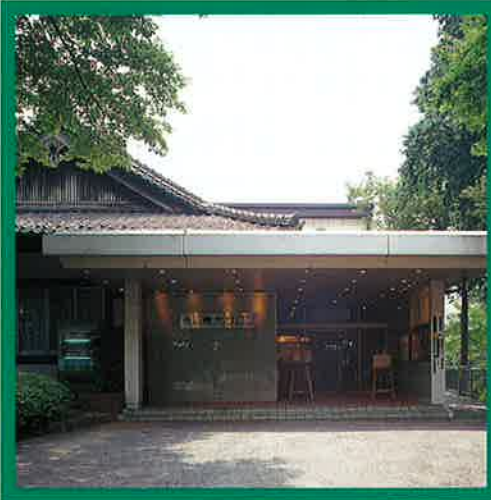
◀狭山東武サロン(右)と八幡神社(左)の外観。両者は内部でつながっているため、移動もスムーズです。

その八幡神社の来歴をひもとけば、そもそも応神天皇や天照皇大神などを祀る由緒正しい神社で、室町時代に創建されたといわれています。文武興隆の神として、さらに母子愛の神として、安産祈願から初宮詣、七五三など、広く地元の人々信仰を集め、親しまれてきました。そして、春には桜花から新緑へ、秋には錦の紅葉と、鎮守の森の豊かな自然も、若いおふたりの祝典に彩りを添えます。 そんな神社の本格的な挙式では、もちろん、新郎は紋付袴、新婦は綿帽子に白無垢といった衣裳に身を包んで…。気持ちを一新してくれる神聖な儀式は、まさに日本人の心を魅了してくれます。これが、狭山東武サロンの誇る挙式なのです。