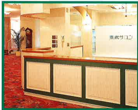
▲玄関を入ってすぐのところにあるレセプションと明るい雰囲気のブライダルサロン。

結婚式という特別な場だからこそ、主役のおふたりやご招待客の皆さまには、日常とはちがう、とびきりの時間を過ごしていただきたい……。そんな私たちの願いが、必ず実現するよう努めています。