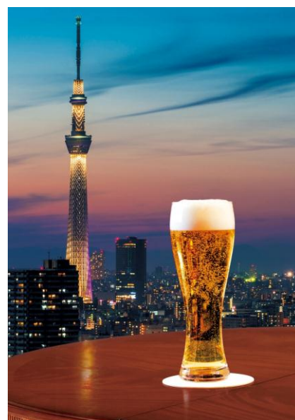
△「納涼ハレテラス エキビア スカイツリービュー」イメージ