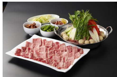
△「しゃぶしゃぶちゃんこ鍋」イメージ

キャベツ、人参、水菜、もやし、玉ねぎなどのたっぷり野菜と、鶏つくね、豚コマ肉が入った特製醤油ダレの“ちゃんこ”をお召し上がりいただきながら、国産牛を“しゃぶしゃぶ”してお召し上がりいただく“下町”らしいメニューです。