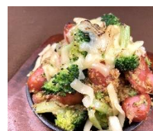
ブロッコリーとウインナー 粒マスタード焼き