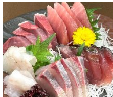
豊洲直送お造り五種盛り