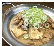
豚もつ豆腐どっかん千寿葱