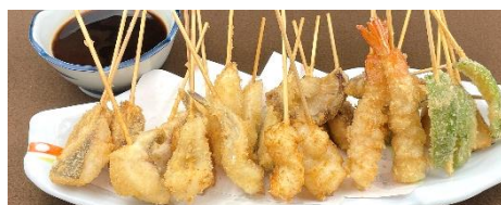
鮮魚のお好み串揚げ